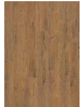
Roble Agreste PIQ8-V011