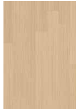
Roble Sereno PIQ8-V010